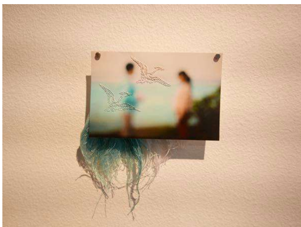
title: 蓬莱郷ハイビジョン