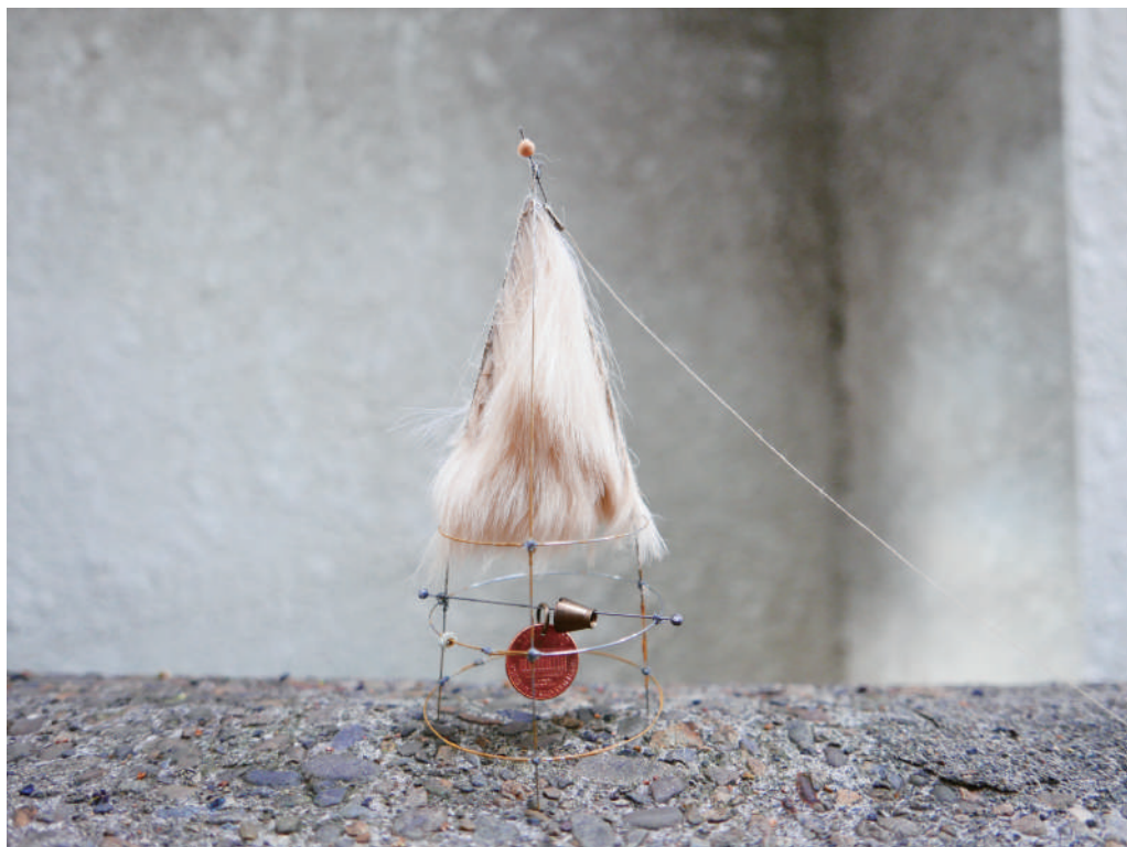
title: Tipi year: 2022